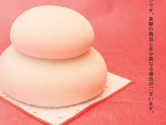
写真はイメージです。実際の商品と多少異なる場合がございます。