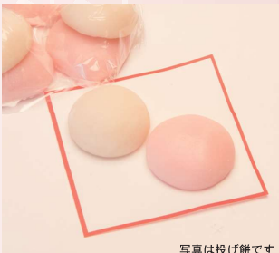
写真は投げ餅です